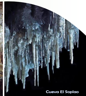
Cueva El Soplao