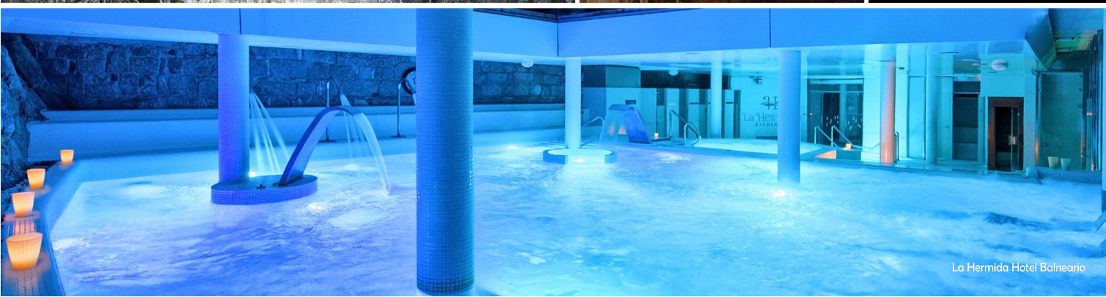
La Hermida Hotel Balneario