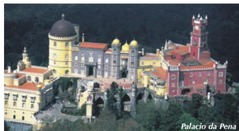
Palacio da Pena