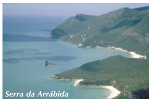
Serra da Arrábida

Sesimbra. Bullicioso pueblo pesquero, cuyos "bifes de espadarte" son sublimes. Ruinas del castillo y empinadas callejuelas.