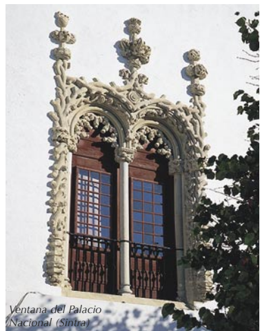
Ventana del Palacio Nacional (Sintra)