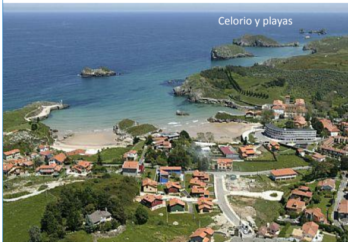
Celorio y playas

Es una oferta Turisnorte. Plazas limitadas. IVA incluido. Condiciones: www.turisnorte.es Tarifa No Reembolsable. Tlf. información: 690 662 812