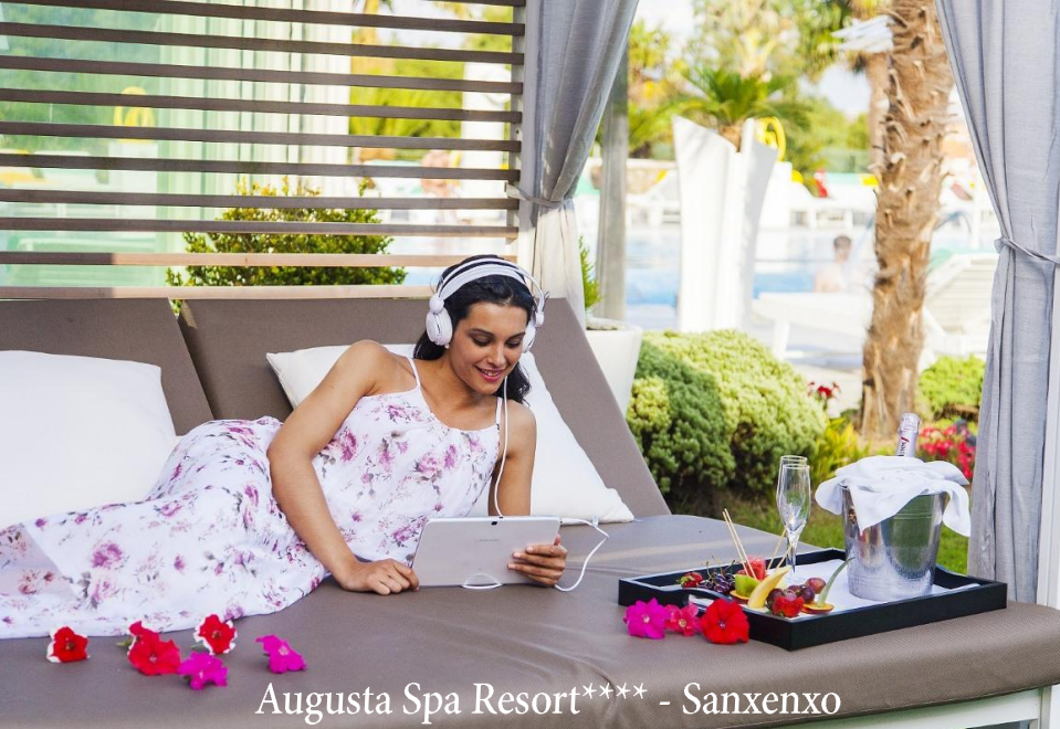
Augusta Spa Resort**** - Sanxenxo