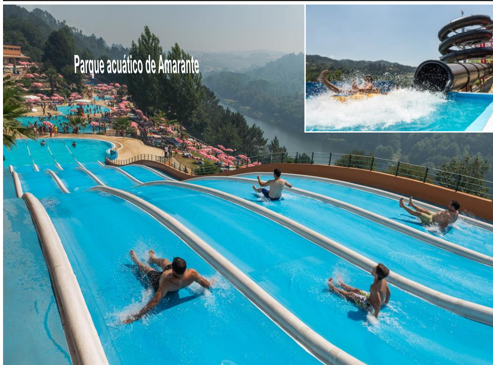
Parque acuático de Amarante