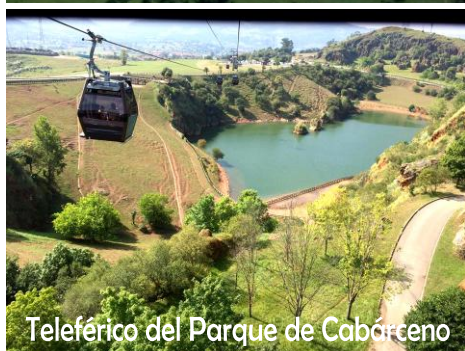
Teleférico del Parque de Cabárceno

Programa válido de 25 enero a 23 Diciembre 2017 e incluye: