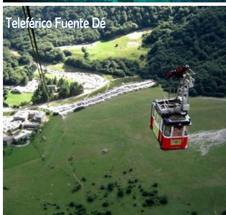
Teleférico Fuente Dé