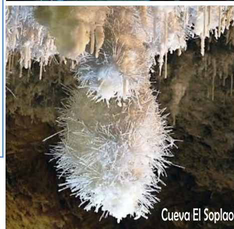
Cueva El Soplo