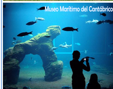
Museo Marítimo del Cantábrico