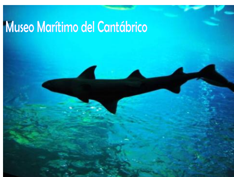
Museo Marítimo del Cantábrico