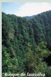
Bosque de laurisilva